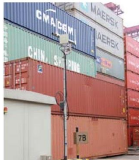
▲ 在關鍵位置增設多跳網絡節點 (node AP)，可提升貨櫃碼頭的網絡覆蓋範圍及傳輸速度。